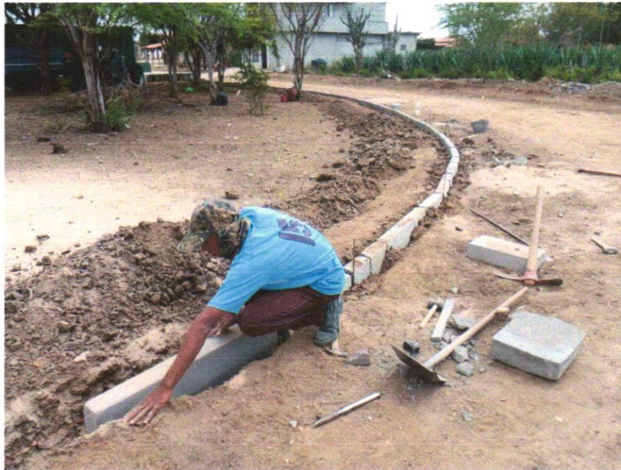
Foto 03- ASSENTAMENTO DE GUIA (MEIO-FIO) EM TRECHO RETO, CONFECCIONADA EM CONCRETO PRÉ-FABRICADO, DIMENSÕES 100X15X13X20 CM (COMPRIMENTO X BASE INFERIOR X BASE SUPERIOR X ALTURA), PARA URBANIZAÇÃO INTERNA DE EMPREENDIMENTOS. AF_06/2016_P