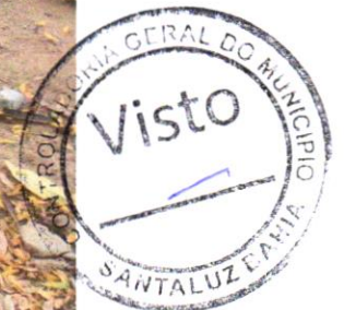
Foto 06 - PAVIMENTAÇÃO EM CONCRETO, COM ESPESSURA DE 7 CM, COM ACABAMENTO FEITO UTILIZANDO ALISADORA DE CONCRETO (HELICOPTERO), INCLUIDO TELA DE AÇO SOLDADA NERVURADA CA60, Q196 (3,11 KG/M 2 ), DIAMETRO DO FIO 5.0 MM, LARGURA = 2,45 M, ESPAÇAMENTO DA MALHA = 10 X 10 CM, JUNTA DE DILATAÇÃO EM PVC A CADA 2,00 M, CONCRETO FCK = 20 MPA

Evaldo Almeida Moraes Evaldo Almeida Moraes Engenheiro Civil RNP 051419303-3