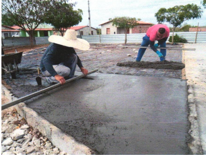
Foto 05 - PAVIMENTAÇÃO EM CONCRETO, COM ESPESSURA DE 7 CM, COM ACABAMENTO FEITO UTILIZANDO ALISADORA DE CONCRETO (HELICOPTERO), INCLUIDO TELA DE AÇO SOLDADA NERVURADA CA60, Q196 (3,11 KG/M 2 ), DIAMETRO DO FIO 5.0 MM, LARGURA = 2,45 M, ESPAÇAMENTO DA MALHA = 10 X 10 CM, JUNTA DE DILATAÇÃO EM PVC A CADA 2,00 M, CONCRETO FCK = 20 MPA