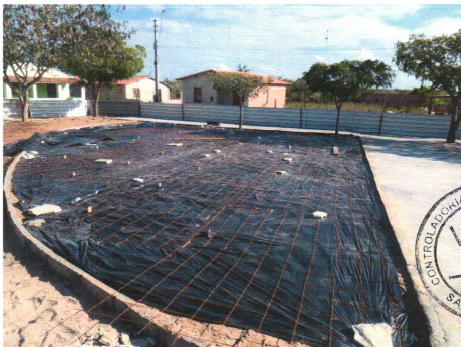
Foto 04 - ASSENTAMENTO DE GUIA (MEIO-FIO) EM TRECHO RETO, CONFECCIONADA EM CONCRETO PRÉ-FABRICADO, DIMENSÕES 80X08X08X25 CM (COMPRIMENTO X BASE INFERIOR X BASE SUPERIOR X ALTURA), PARA URBANIZAÇÃO INTERNA DE EMPREENDIMENTOS. AF_06/2016