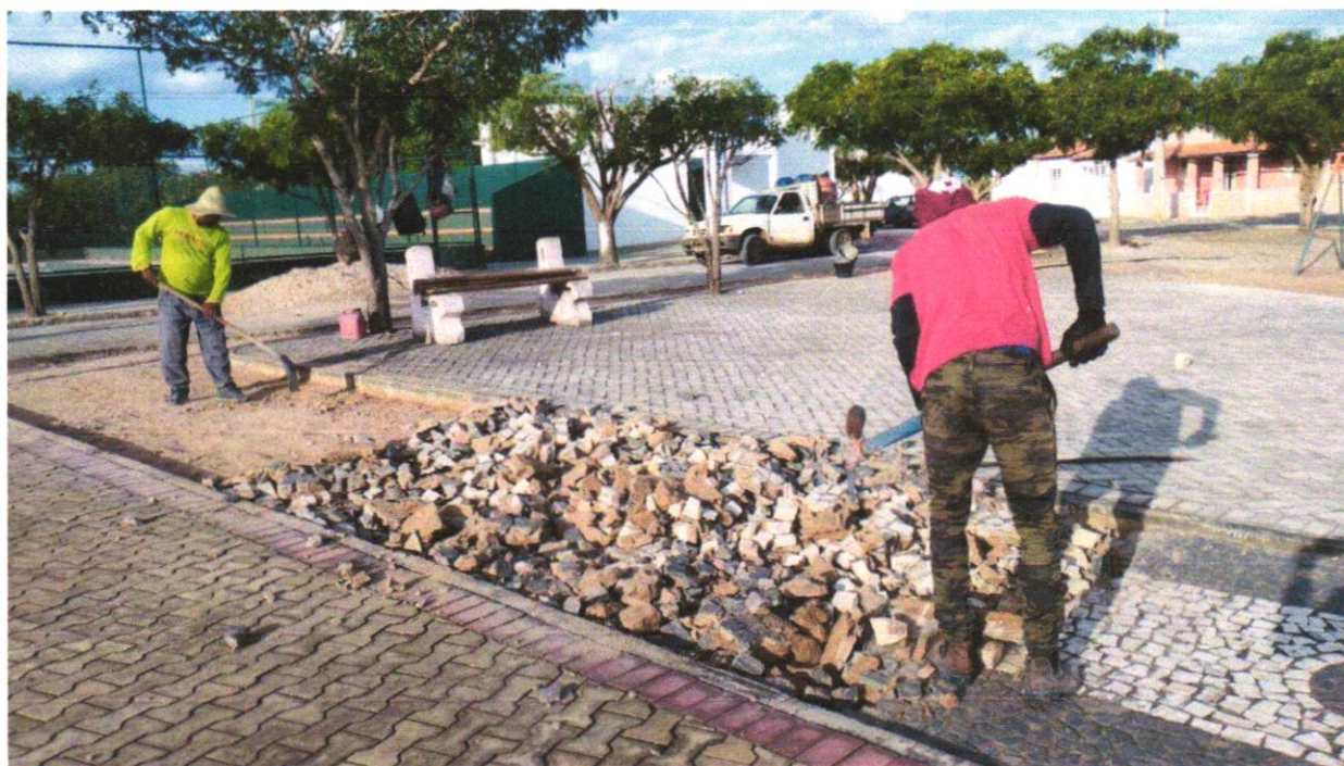
Foto 07 - Remoção de piso em Pedra Portuguesa