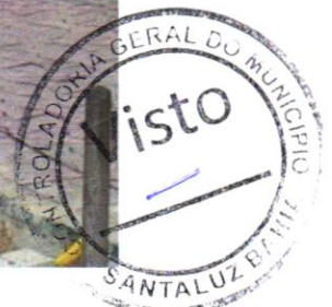
Foto 02 – RETIRADA DE MEIO-FIO DNER / ECONOMICO COM EMPILHAMENTO E SEM BOTA FORA